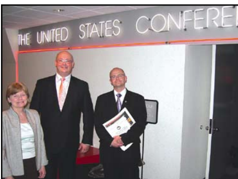
Waszyngton, konferencja burmistrzów