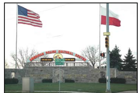
Detroit, Polsko-Amerykańskie Centrum Kulturalne