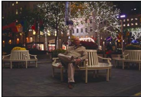
New York, chwila odpoczynku