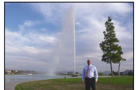
Phoenix, Fountain Hill, najwyższa fontanna świata