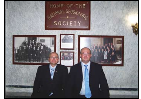
Waszyngton, siedziba National Geographic