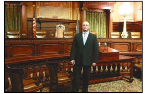
Philadelphia, Sąd Stanowy Stanu Pensylwania