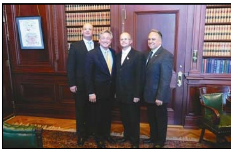
Philadelphia, spotkanie ze speakerem (marszałkiem) Kongresu Stanu Pensylwania