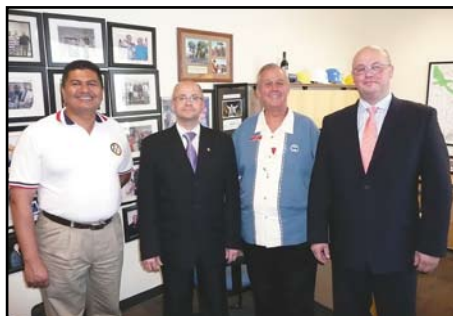
Phoenix, Fountain Hill, spotkanie z lokalnymi władzami