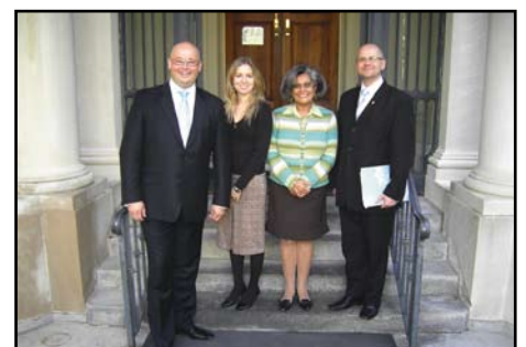
Waszyngton, ostatnie spotkanie z koordynatorami programu IVL przed ich siedzibą, Meridian International Center