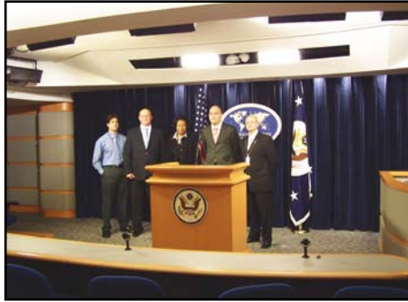
Waszyngton, zwiedzanie Departamentu Stanu