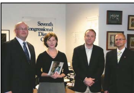
Seattle, chwila ze współpracownikami kongresmena Stanu Waszyngton