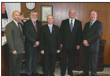
Detroit, instytut naukowy HAST, zajmujący się współpracą z organizacjami polonijnymi