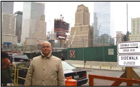
New York, „strefa zero” (dawne World Trade Center)