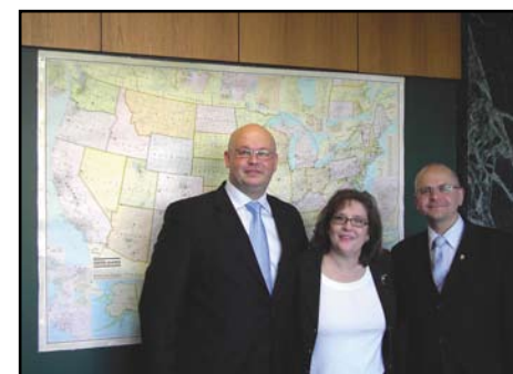
Waszyngton, wizyta w organizacji wspierającej powiaty NARC