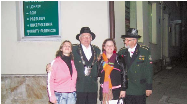
Bracia Kurkowi wcale nie onieśmielali rezolutnej młodzieży z Francji