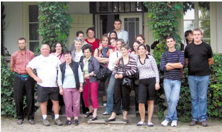
Dworek w Koszutach podobał się wszystkim gościom...