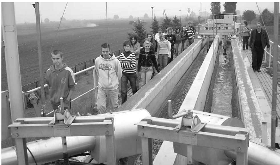
Uczniowie szkół średnich zwiedzają Gminną Oczyszczalnię Ścieków w Chwałkowie i Stację Uzdatniania Wody w Środzie

W dniach 24-28 września br. Gminna Oczyszczalnia Ścieków w Chwałkowie i Stacja Uzdatniania Wody w Środzie gościły uczniów szkół średnich powiatu średzkiego.