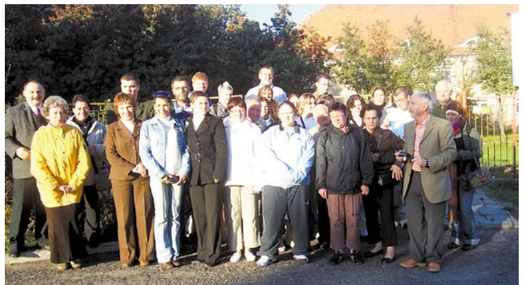
...i czas ruszać w drogę do Francji