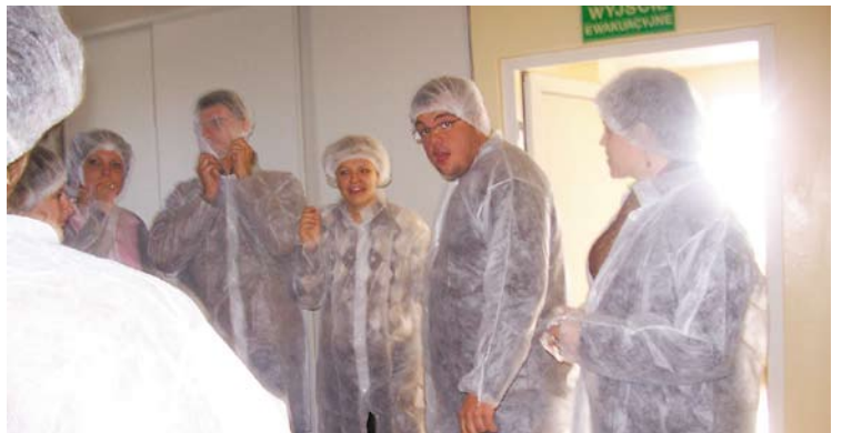
A ta grupa kosmitów to goście francuscy podczas zwiedzania „Jany”. Oj, było śmiechu, było...