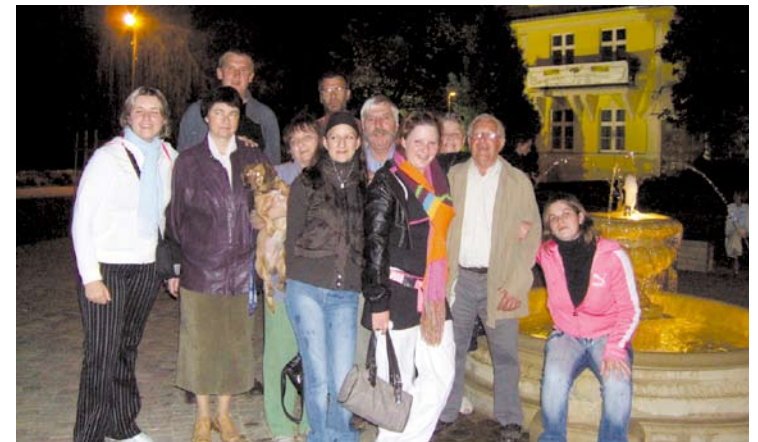
..podświetlone wieczorem Liceum i fontanna na skwerku także.