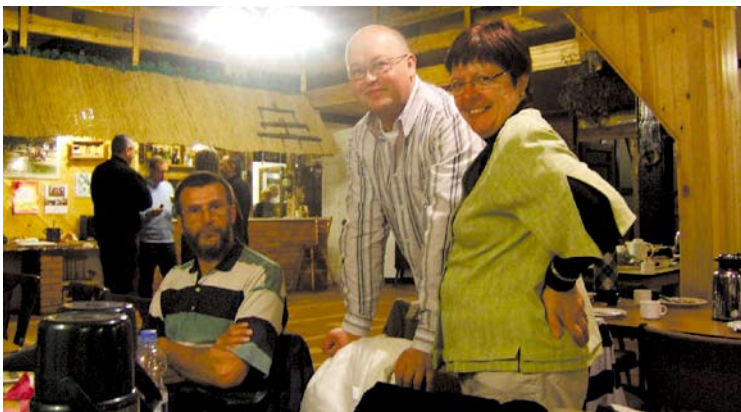
Pożegnalny wieczór w Młodzikowie...