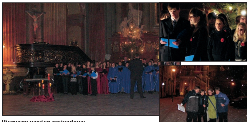
Pierwszy występ wyjazdowy – koncert we farze poznańskiej, styczeń 2008