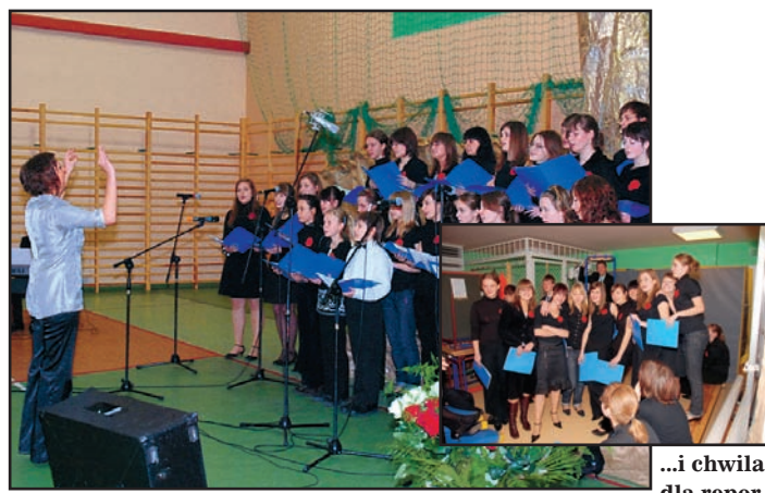
Jubileusz 85-lecia LO