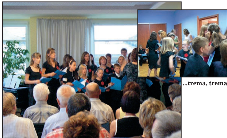
Pierwszy koncert w bibliotece, czerwiec 2007