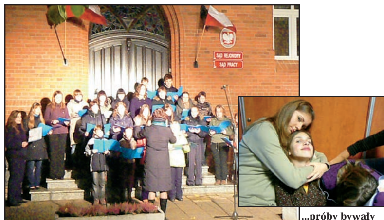
Obchody rocznicy 20 Października