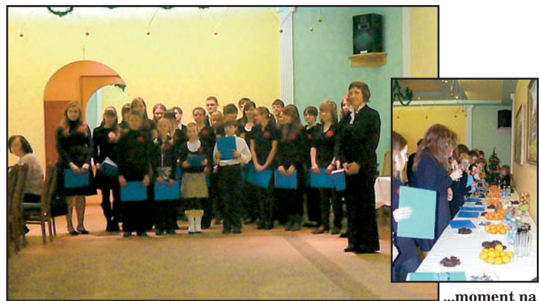
Koncert wigilijny dla emerytowanych pracowników Urzędu Miejskiego