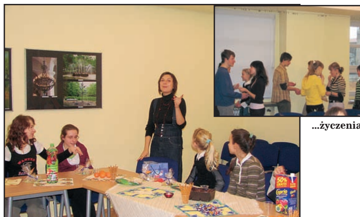
Spotkanie opłatkowe członków chóru