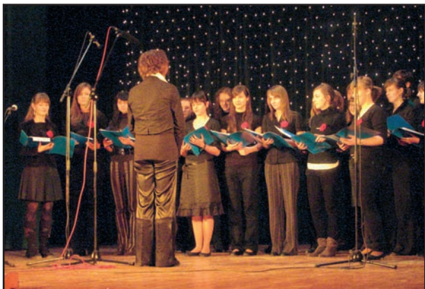
Koncert Wielkiej Orkiestry Świątecznej Pomocy