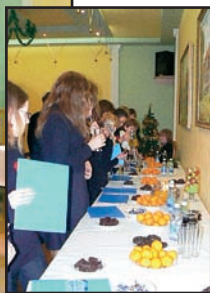
...moment na pokrzepienie się