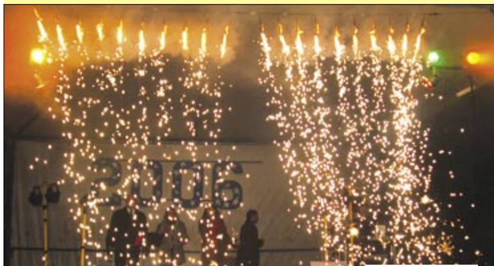
Na imprezie sylwestrowej na Starym Rynku bawiły się tłumy średzian

W ostatni dzień grudnia na Starym Rynku odbyła się impreza sylwestrowa. Od godziny 22.30 muzyka przygotowana przez Diǳdżeja, zachęcała do zabawy.