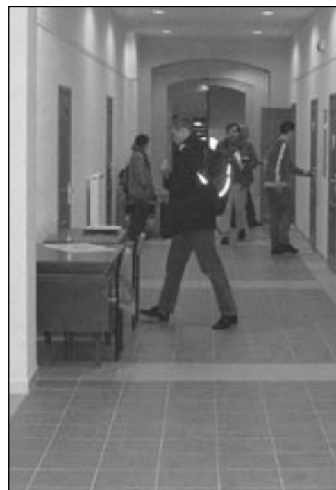
Urząd Miejski ma odnowione korytarze, klatki schodowe i stolarkę drzwiową