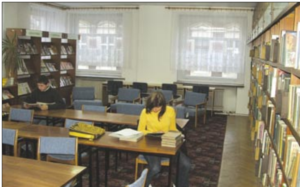
Trzy nowe komputery zostaną ustawione w czytelni Biblioteki Miejskiej

waniem, a władze samorządowe zapewnią bieżące utrzymanie punktu. Dzięki staraniom Burmistrza Miasta w centrum miasta przybędzie więc miejsce, gdzie każdy zainteresowany wyszukaniem informacji w Internecie będzie mógł to zrobić bezpłatnie. Jest to forma pomocy władz miasta m.in. dla osób uczących się na terenie gminy. MW