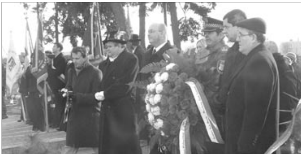
Burmistrz Miasta wraz z Wiceburmistrzem i Przewodniczącym Rady Miejskiej złożyli wieniec pod odsłoniętą tablicą

Po uroczystości odsłonięcia tablicy wieńce i kwiaty zostały złożone na kwaterze powstańczej znajdującej się na cmentarzu. TT