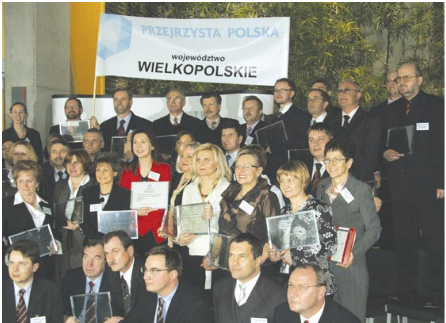
Wyróżnieni samorządowcy z Wielkopolskiej na wspólnym zdjęciu