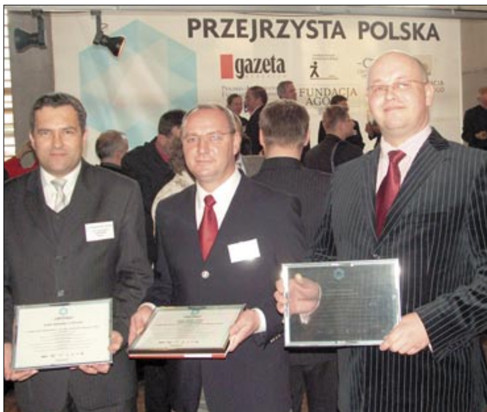
Burmistrz Wojciech Ziętkowski odebrał certyfikat „Przejrzysta Polska” w warszawskiej siedzibie „Gazety Wyborczej”