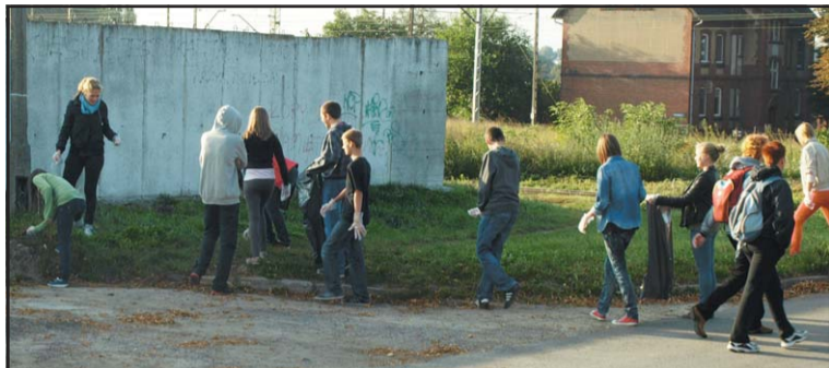
Uczniowie Gimnazjum nr 2 sprzątający tereny przy ul. Łąkowej.

przez trzy dni (16 – 18.09.) wyposażeni w worki na śmieci i gumowe rękawice zbierali z lasów, parków i osiedlowych trawników wszystko to, co bezmyślnie wyrzucili tam inni. Niestety, mimo iż