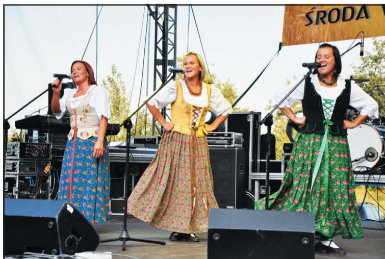
Występ góralskiego zespołu Gronicki.

czął od krótkiej lekcji gwary śląskiej, a następnie przeszedł do zabawiania publiczności zarówno dowcipem jak i śpiewem. Bezpośrednio po Ślązaku na scenie pojawiła się gwiazda wieczoru zespół Sumptuastic ze swoimi największymi przebojami pt. „Kolysanka” czy „Za jeden uśmiech twój”. Tegoroczne dożynki