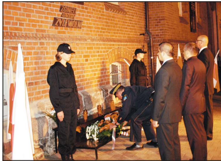
Władze miasta składające kwiaty przy tablicy na ścianie sądu.

Wyjątkowo 16 września a nie w rocznicę czyli 17 września odbyła się na Łąkach Kijewskich uroczystość upamiętniająca rozstrzelanie przez hitlerowców 21 mężczyzn.