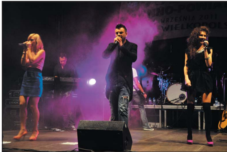
Występ gwiazdy tegorocznych dożynek, zespołu Sumptuastic.