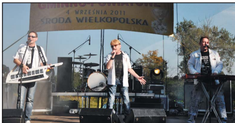
Występ zespołu Top One.