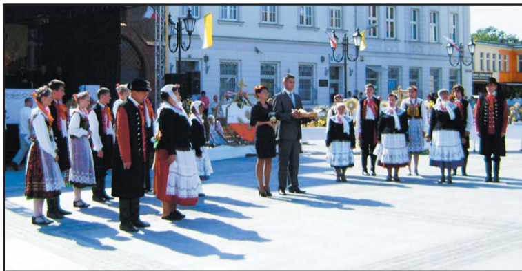
Obrzęd dożynkowy w wykonaniu zespołu Ziemia Wrzesińska.