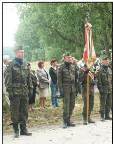
6 Batalion Dowództwa Sił Powietrznych ze Śremu.