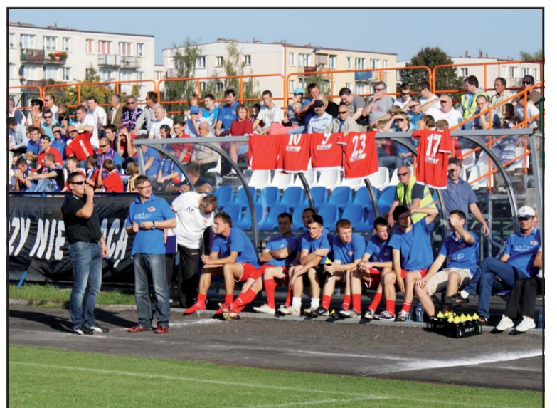
Kibice siedzący na nowych trybunach.