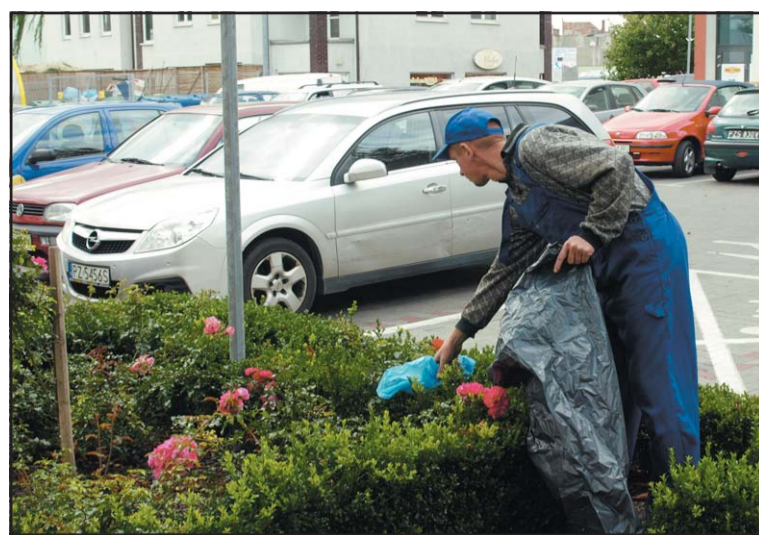
Aresztant sprzątający teren wokół Urzędu Miejskiego.

co roku dzięki tej akcji koordynowanej przez Fundację „Nasza Ziemia” do worków trafiają setki ton śmieci – ich liczba nie maleje. Na miejsce zebranych butelek, papierków czy reklamówek bezkarnie wyrzucane są kolejne. Warto wspomnieć, że guma do żucia rozkłada się pięć lat, reklamówka 400, a szklana butelka nawet 4000. Dzięki akcji „Sprzątanie Świata”, przynajmniej część z nich wyładowała tam, gdzie powinno – na wysypisko. W akcję od samego początku aktywnie włącza się Gmina Środa Wielkopolska. Podobnie było w tym roku. Referat Rolnictwa i Ochrony Środowiska zakupił w związku z akcją 620 worków na śmieci, 1500 rękawic foliowych oraz otrzymał z powiatu, który również aktywnie wspiera akcję 200 worków i 500 rękawic. Gminę sprzątają przede wszystkim placówki oświatowe zawsze pozytywnie odpowiadające na akcję. Sprzątają one określone tereny. Uczniowie SP 2 z Oddziałami Integrycyjnymi sprzątają tereny wokół szkoły, SP3 teren ul. Olimpijskiej oraz rejon wąskotorówki. Gimnazjaliści „jedynki” zbierają śmieci na ul. Niedziałkowskiego, a uczniowie