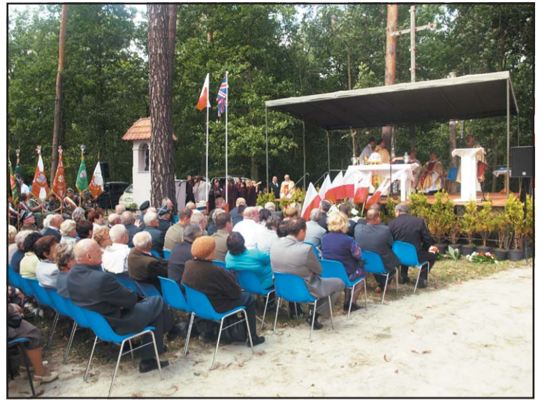
Msza Święta Polowa w lesie w Janowie.