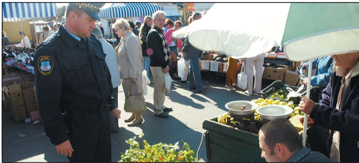
Strażnik Miejski dokonujący kontroli wag wraz z przedstawicielem Urzędu Miar.

W dzień targowy, 15 września tego roku Strażnicy Miejscy wspólnie z przedstawicielami Obwodowego Urzędu Miar w Gnieźnie skontrolowali handlujących na targowisku w skutek czego nałożyli mandaty karne za brak legalizacji wag.