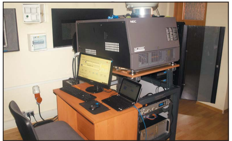
Nowy projektor zamontowany w Kinie Baszta.

W Baszcie został zamontowany również nowy srebrny ekran będący prezentem od anonimowego sponsora. Całość inwestycji kosztowała 478.760,28 zł. Z tej kwoty 200 tys. zł pochodzi z budżetu gminy, a 186.862 zł stanowi dotację z Państwowego Instytutu Sztuki Fil-