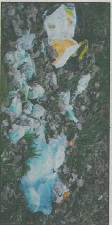
Zamieszczony teren działek przy ul. Wrzesińskiej.

tych obszarach. Przypominamy, że mandatarz za wyrzucanie śmieci w miejscach niedozwolonych może wyneść nawet do 500 złotych. Jak mówi Paweł Ludwiczak, Straż Miejska zaprasza