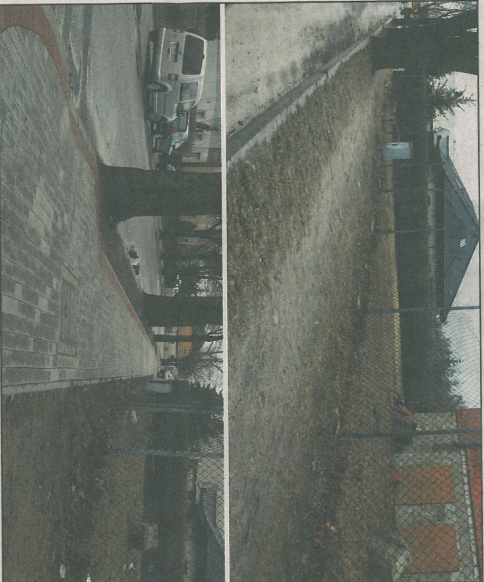
Chodnik przy ulicy Wawrzyńska przed i po remoncie.