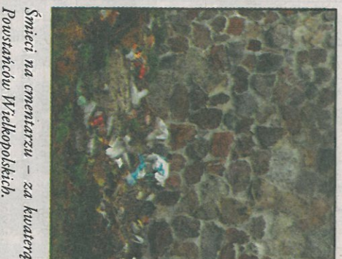
Śmieci na cmentarzu – za kwaterą Powstańców Wielkopolskich.