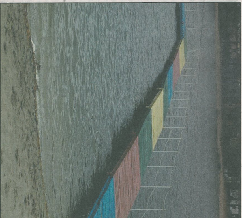
Pomosty nad jeziorem, które będą wymienione.