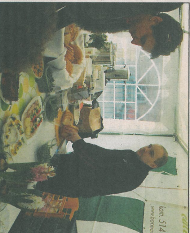
Przysmaki świąteczne prezentowane przez Bar MAX.

W czasie pokazu, który cieszył się sporym zainteresowaniem Średzianie mogli przyrzyć się jak przygotować tradycyjne potrawy regionalne, m.in.: zupę chrzanową, żurek staropolski, mazurek wielkanocny, babeczki nadziewane oraz zajączki z masy cukrowej. Każdy, kto przybył na kiermasz mógł podziwiać specjalnie przygotowane tradycyjnie, wielkanocny sofi ze święcącym jedzeniem. Podczas imprezy nie zabrakło także atrakcji dla najmłodszych. Organizatorzy przygotowali dla nich wiele konkursów