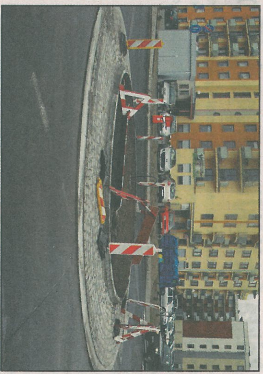
Nowe ronda na skrzyżowaniu ul. Weychana z Topolską.

Ronda na obwodnicy W najbliższym czasie rozpocznie się budowa dwóch rond: na ul. Strzeleckiej oraz na ul. Nekielskiej w miejscach skrzyżowania tych ulic z nowobudowaną północną obwodnicą Środy. Budowa tych skrzyżowań w całości zostanie sfinansowana z budżetu gminy. Radni Miejscy podjęli już