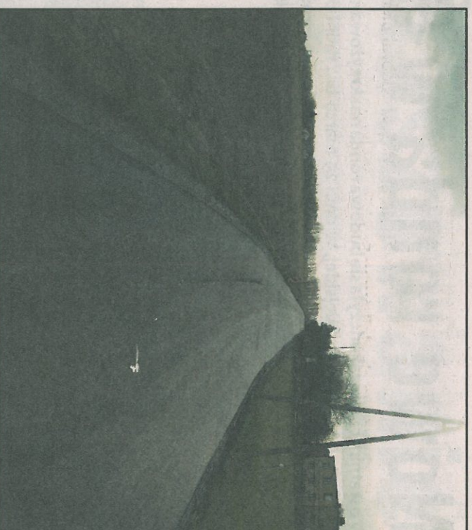
Wyremontowana droga w Janowie.