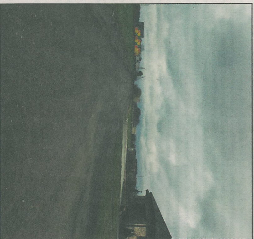
Obecna nawierzchnia ul. Akacjowej.