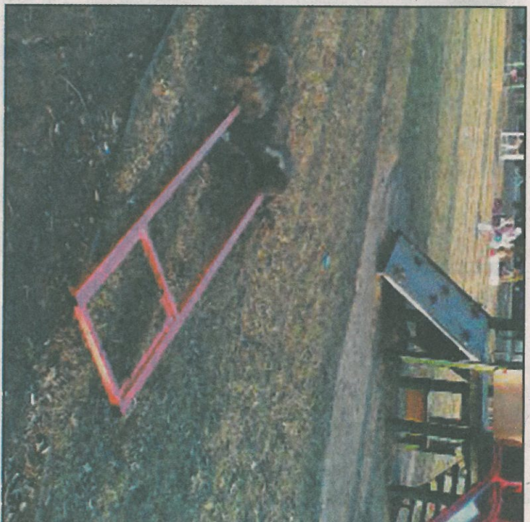
Zdewastowany Regulamin Parkowy na ul. Lipowej.