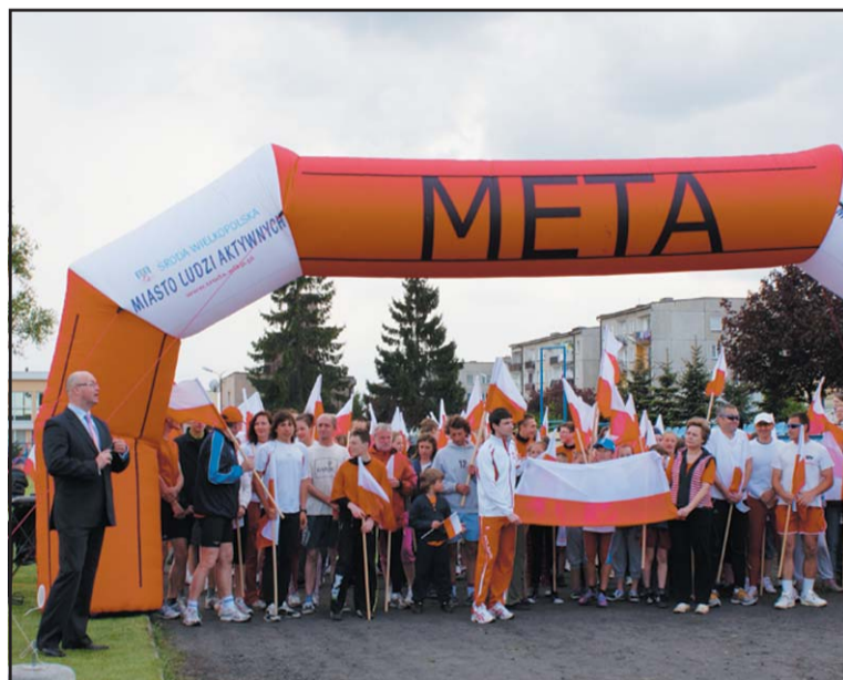
Tuż przed startem Biegu z Flagą.