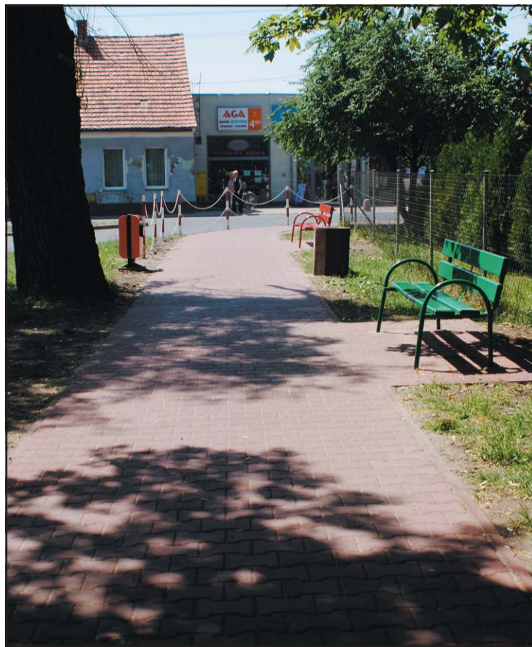
Roboty mają się rozpocząć na przełomie maja i czerwca tego roku.

W toku postępowań przetargowych związanych z przebudową chodników pojawiły się również oszczędności, za które gmina przewiduje remont dodatkowych odcinków chodnika w mieście. Planuje się wykonać nowe chodniki na ul. Kolegiackiej – obustronnie, w rejonie ul. Nekielskiej i ul. Cichej oraz w Koszutach.