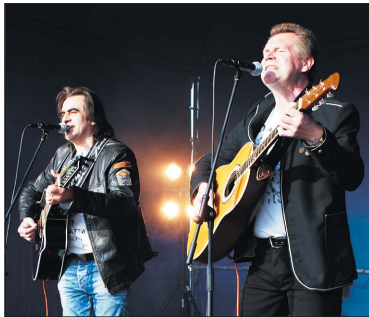
Koncert zespołu VOX.