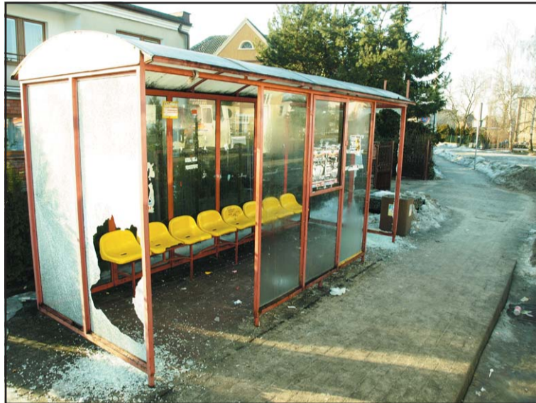
Wiata przystankowa, dworzec PKS.

Nietrudno również zauważyć w po-weekendowy poranek mnóstwo