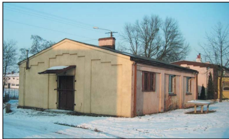
Świetlica w Chudzicach.