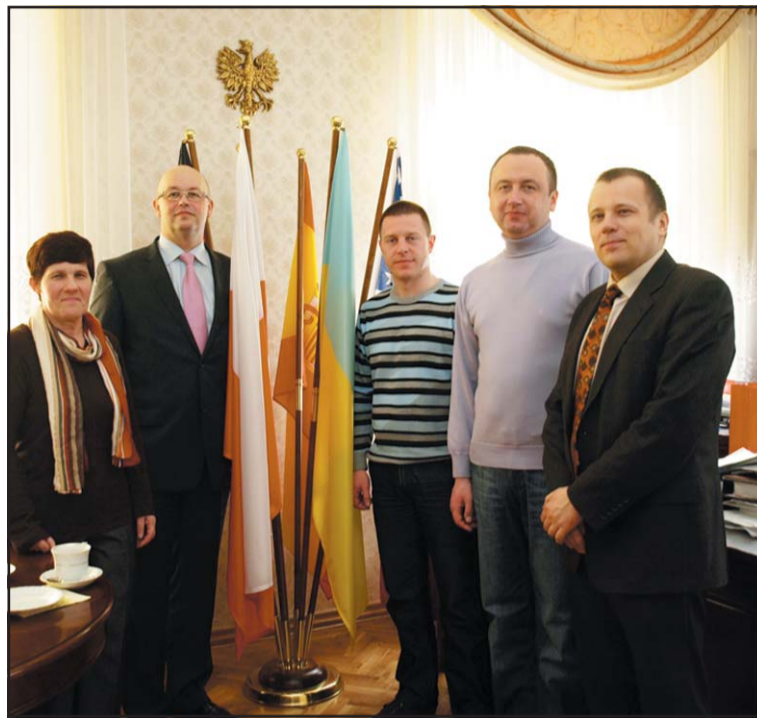
Delegacja z Ukrainy.