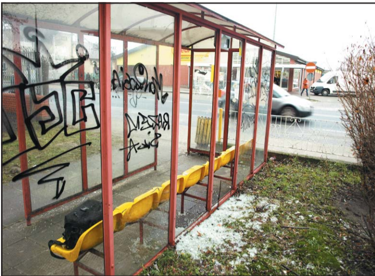
Zniszczona wiata przystankowa na ul. Niedziałkowskiego.

cinie i Winnej Górze. Sprawcy najczęściej wybijają elementy szklane