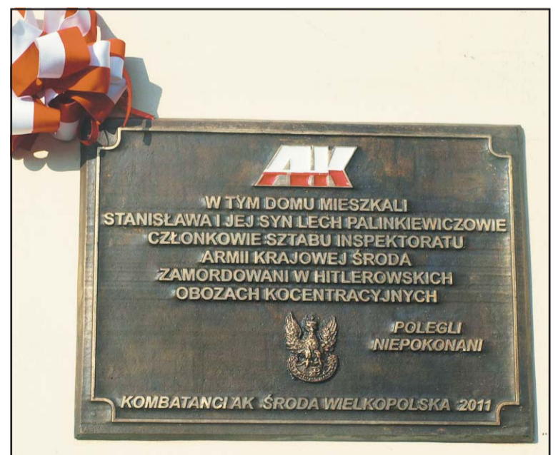
Tablica poświęcona pamięci Palinkiewiczów.