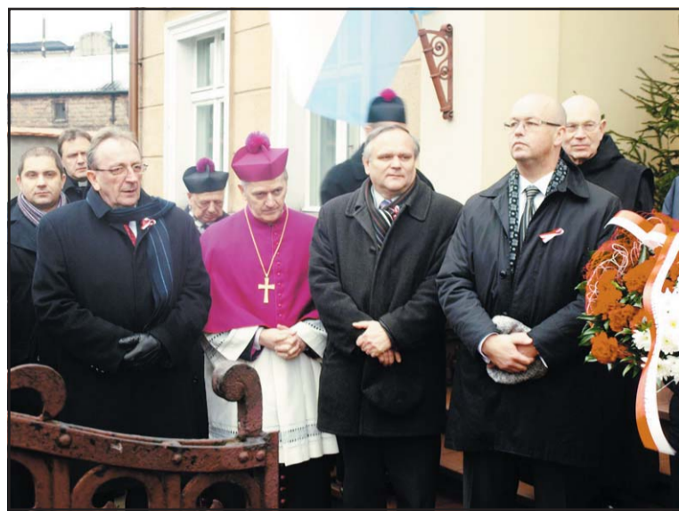
Na zdjęciu władze miasta i powiatu z zaproszonymi gośćmi.