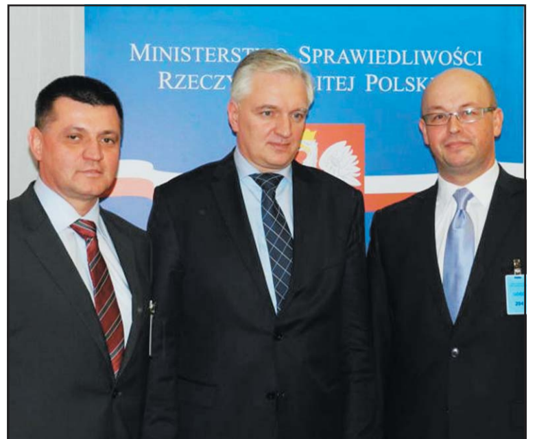
Burmistrz Miasta, Komendant Straży Miejskiej oraz Minister Sprawiedliwości.

Po reformie, jeżeli np. w sądzie w Środzie będzie zbyt długi okres oczekiwania na rozprawę sądową, a we Wrześni rozprawy będą odbywały się sprawnie, czas oczekiwania na posiedzenie sądowe będzie krótki, to Prezes Sądu Rejonowego będzie mógł zdecydować o przeniesieniu sędziego z Wrześni do Środy Wiel-