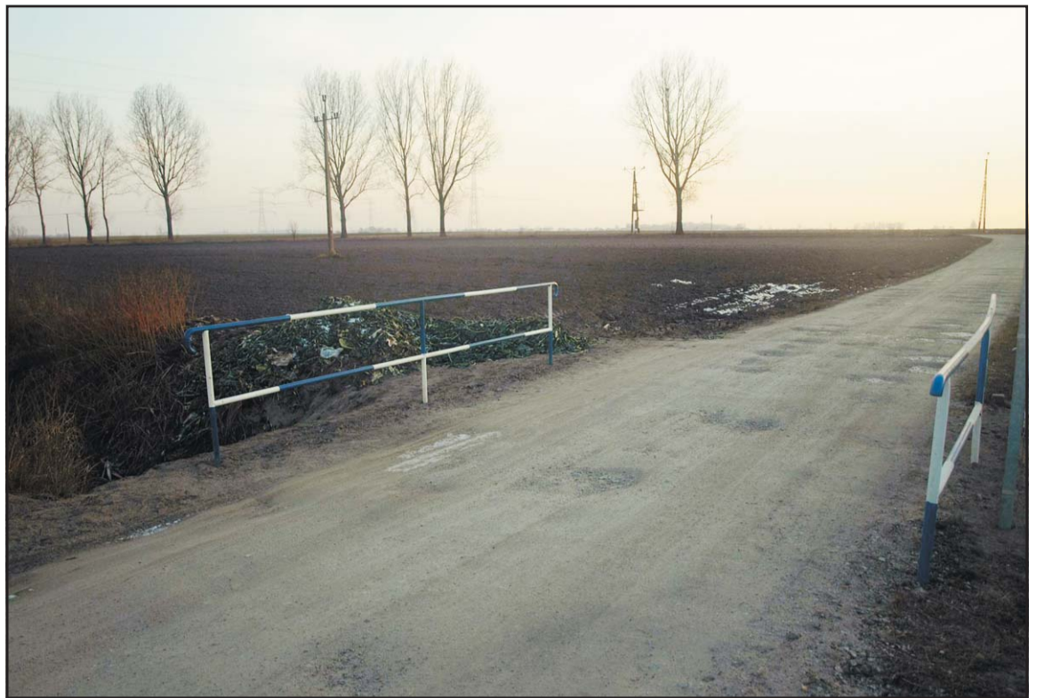
Nowy przepust w Januszewie.