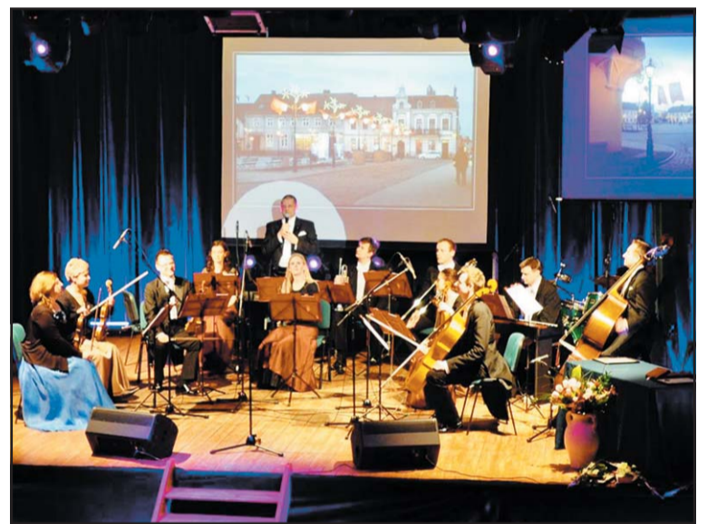
Występ Festival Orchestra.