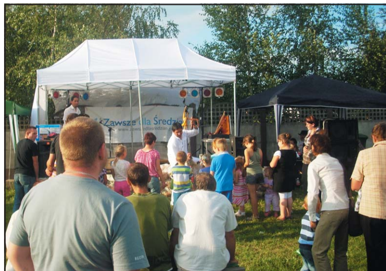
Konkursy dla dzieci zorganizowane na festynie w Pławcach.

odbywają się festyny. Zabawy plenerowe rozpoczynają się wczesnymi godzinami popołudniowymi. Podczas spotkań dzieci mogą poskakać na specjalnych „dmuchawcach”, a starsi