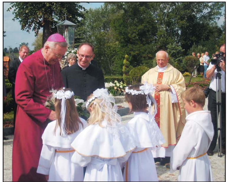
Powitanie Księdza Arcybiskupa w Mącznikach

Parafia została erygowana już w XIII w., wzmiankowana w 1404 roku. Wieś Mączniki w latach 1299 – 1796 była własnością Kapituły