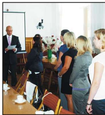
Nauczyciele mianowani składający uroczyste ślubowanie 3000 m.