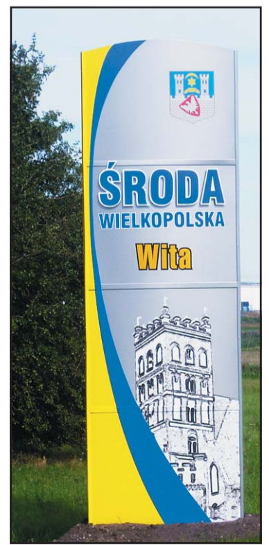
Nowy Witacz przy wjeździe do Środy od strony Poznania.

W czterech miejscach tj. przy ul. Brodowskiej, ul. Niedziałkowskiego, ul. Kórnickiej oraz ul. Gnieźnieńskiej stanęły nowe tzw. „witacze”. Zastąpiły one zużyte, stare, niebieskie tablice z herbem miasta i jego nazwą. Nowe tablice zarówno witają przybywających do miasta oraz żegnają opuszczających je. Z jednej strony widnieje na nich kościół kolegiacki, z drugiej wieża ciśnién. Koszt czterech takich witaczy wyniósł 36 tys. zł. Nowe „witacze” pozytywnie wpływają na promocję naszego miasta. Podróżny przybywający z daleka do Środy Wielkopolskiej już na samym wjeździe jest informowany o najważniejszych symbolach miasta. „Witacze” są schludne i bardzo nowoczesne. Filip Waligóra redakcja@sroda.wlkp.pl