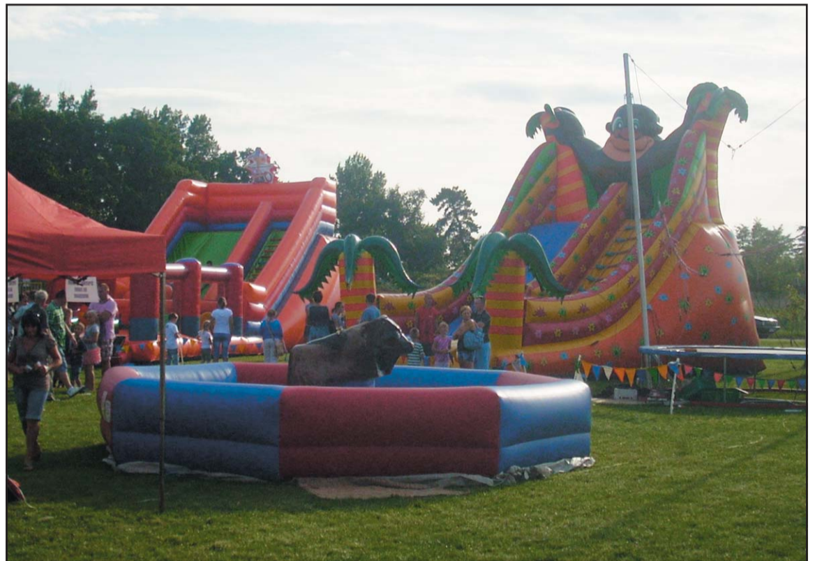
Specjalne dmuchawce dla najmłodszych na festynie w Pławcach.

skosztować piwa w miłej atmosferze. Przez cały czas zabawy uczestnikom towarzyszy muzyka w wykonaniu m. in. Wioli Kaźmierczak. Szczególną atrakcją takich festynów są loterie fantowe, gdzie za małe pieniądze (5 zł za los) można wygrać drogie nagrody np. żelazko a nawet ceramikę sanitarną. Zabawa trwa często do