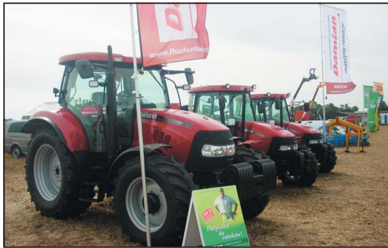
Wystawa sprzętu rolniczego podczas Święta Cebuli i Ziemniaka.