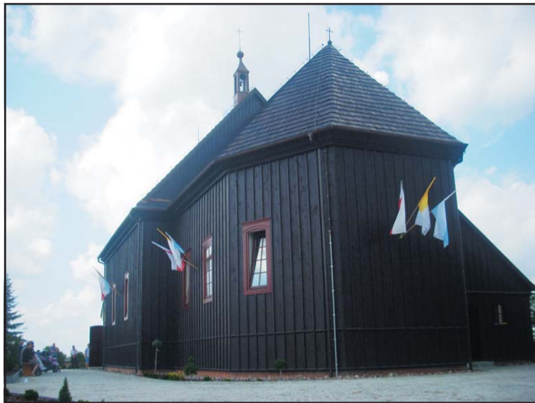
Widok odrestaurowanego kościoła w Mącznikach.