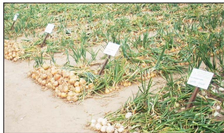
Wystawa poletek demonstracyjnych cebul.

nizować lepszy dostęp do poletek demonstracyjnych. Główną atrakcją spotkania była prezentacja 51 odmian cebuli na specjalnie przygotowanych poletkach doświadczalnych oraz 28 odmian ziemniaka. Zainteresowani uprawą cebuli i ziemniaka mogli podziwiać takie odmiany warzyw jak Volumia, Carrera, Berber, Dali, Latona, Jade. Dla wszystkich zainteresowanych sprzętem rolniczym odbyła się jego wystawa. Na imprezie znalazły też coś dla siebie osoby zajmujące się sprzedażą drzew i krzewów ozdobnych. Podczas święta odbyły się także wykłady naukowe