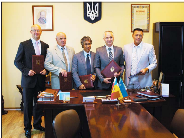
Sygnatariusze porozumienia, burmistrzowie miast.