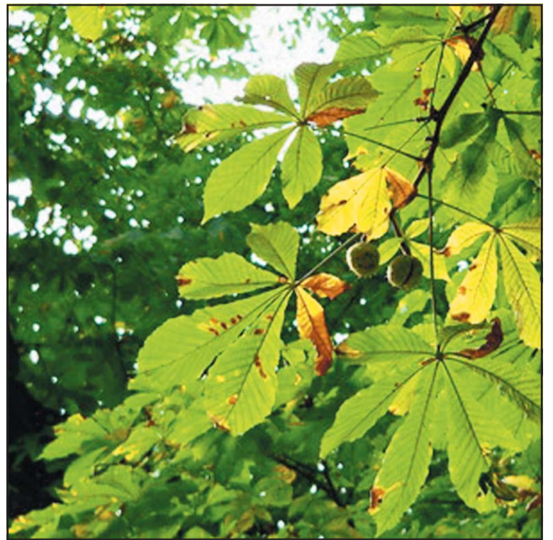
Kasztanowiec zaatakowany przez szkodnika.