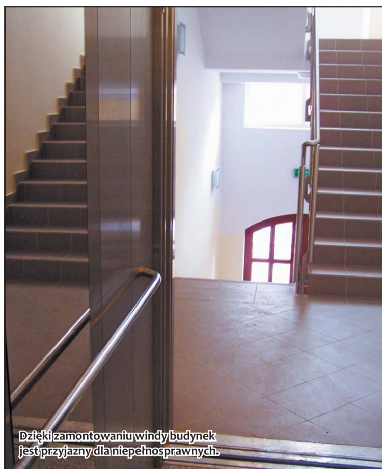
Dzięki zamontowaniu windy budynek jest przyjazny dla niepełnosprawnych.

Warto w tym miejscu zaznaczyć, że nie cały zakres robót został dotychczas wykonany. Na przebudowanym skrzydle, ze względu na fatalne