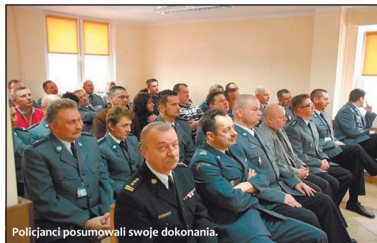
Policjanci posumowali swoje dokonania.

Roczna narada odbyła się także w średzkiej policji. 9 lutego w Komendzie Powiatowej Policji w Środzie Wielkopolskiej policjanci podsumowali swoje działania w 2009 r. Okazuje się, że funkcjonariusze blisko 800 razy zmuszeni byli wyjeżdżać na