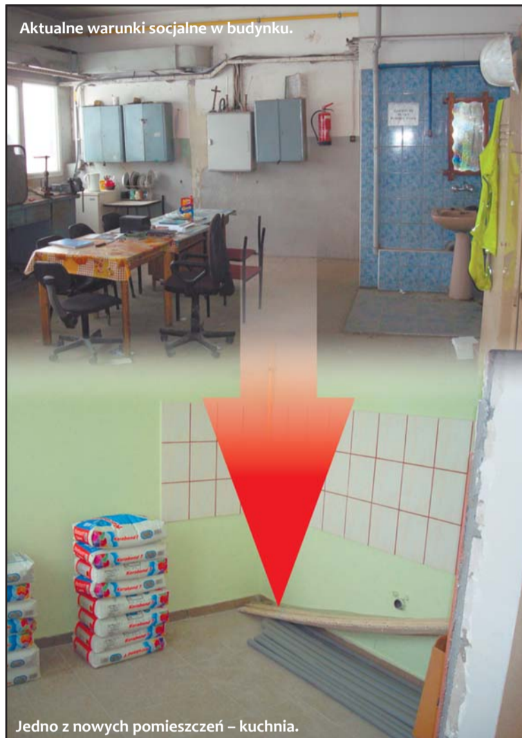
Aktualne warunki socjalne w budynku.