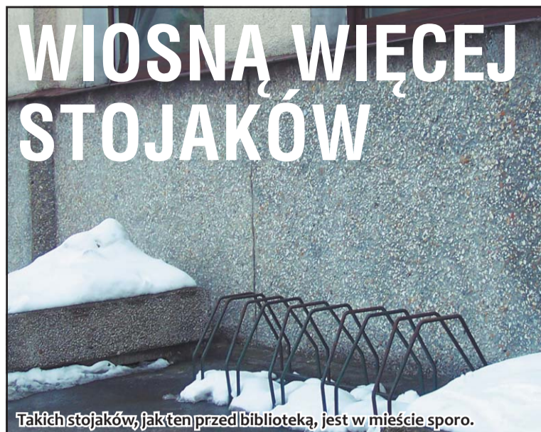
Takich stojaków, jak ten przed biblioteką, jest w mieście sporo.

Wszyscy amatorzy jazdy na jednośladach mogą zacierać ręce. Już wiosną w Środzie Wielkopolskiej pojawią się dodatkowe stojaki na rowery. Bo choć już teraz w mieście stojaków nie brakuje, to wkrótce na średzkich ulicach pojawi się ich znacznie więcej.