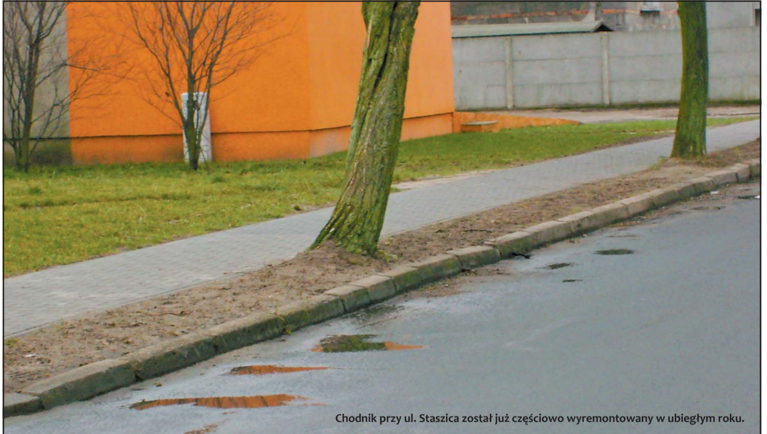
Chodnik przy ul. Staszica został już częściowo wyremontowany w ubiegłym roku.

Także w tym tygodniu gmina ogłosi przetarg na przebudowę ul. Prądzynskiego na odcinku od ul. Kórnickiej do ul. Jackowskiego. Zakres robót obejmie w tym przypadku odtworzenie nawierzchni wraz z budową kanalizacji deszczowej. Przy wykonywaniu prac zbudowana zostanie również kanalizacja sanitarna, do której zostaną podłączeni okoliczni mieszkańcy oraz przedsiębiorstwa posiadające swą siedzibę przy ul. Prądzynskiego.