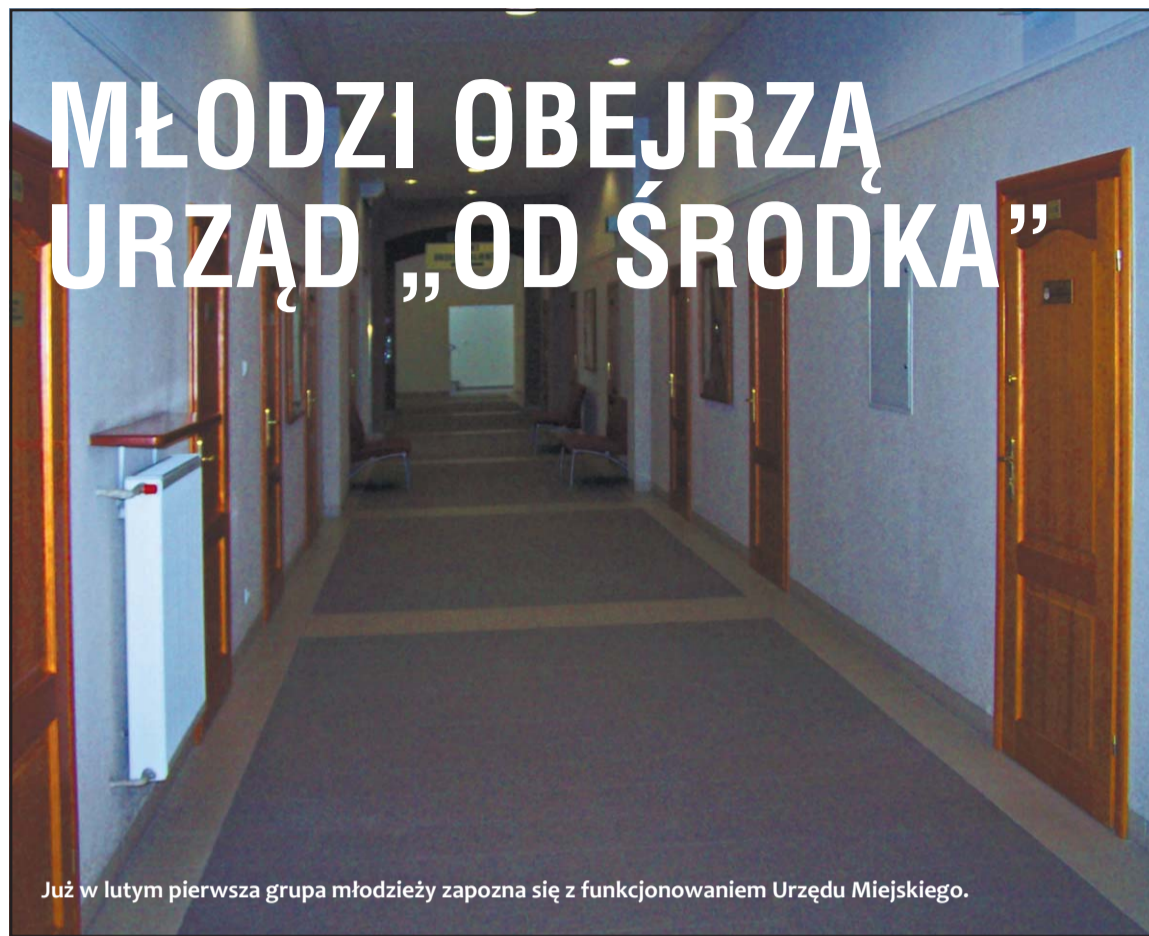
Już w lutym pierwsza grupa młodzieży zapozna się z funkcjonowaniem Urzędu Miejskiego.