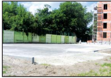
Tak na razie wygląda boisko przy SP nr 2

Przypomnijmy, że oba boiska mają być wielofunkcyjne, co pozwoli na szeroki rozwój sportowy uczniów podstawówek. Taka inwestycja to również oszczędność czasu, miejsca i pieniędzy. Warto przypomnieć, że