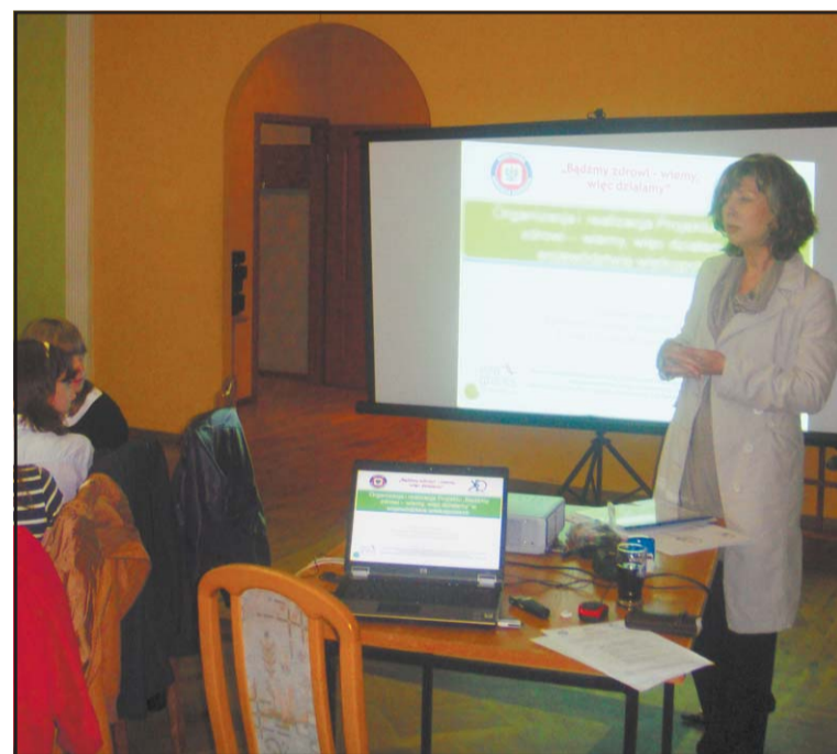
Wojewódzki koordynator projektu wita uczestników szkolenia.

Ostatnie szkolenie w ramach projektu „Bądźmy zdrowi – wiemy, więc działamy” było też doskonałą okazją do podsumowania całego projektu prowadzonego przez Powiatową Stację Sanitarno-Epidemiologiczną