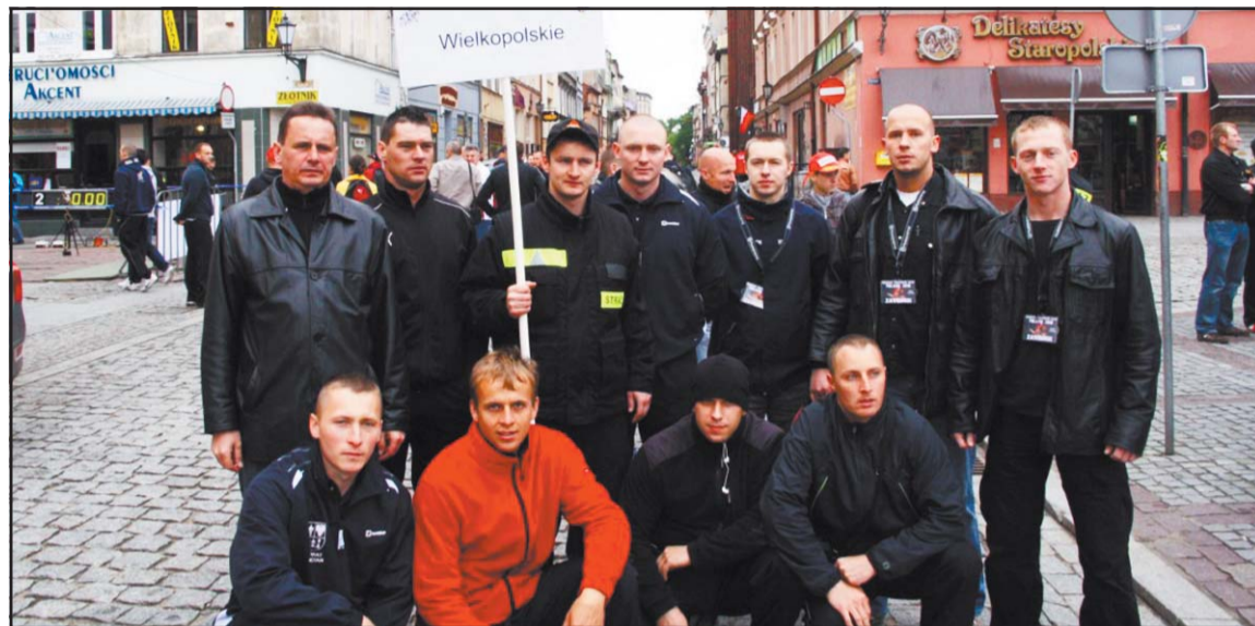
Strażacy w Toruniu.